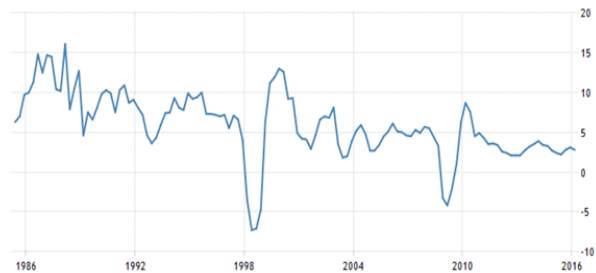
Biểu đồ 1. Tốc độ tăng trưởng GDP của Hàn Quốc giai đoạn 1986-2016.

Sự phát triển thần kỳ của Hàn Quốc từ giữa thế kỷ XX đến nay là kết quả hội tụ của nhiều yếu tố, nhưng không thể không kể đến vai trò của một nhà nước mạnh, “nhà nước phát triển” trong quá trình hoạch định và thực thi chiến lược phát triển kinh tế - xã hội. Kể từ khi hoàn thành công nghiệp hóa, cùng với xu thế toàn cầu hóa kinh tế và xu thế dân chủ hóa xã hội cuối thế kỷ XX - đầu thế kỷ XXI, cách thức vận hành thể chế kinh tế thị trường ở Hàn Quốc và việc thể hiện vai trò nhà nước trong nền kinh tế đã có một số biến chuyển mới.