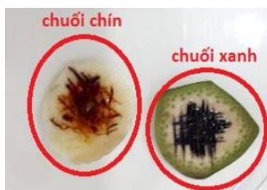
b. Phát hiện tinh bột trong chuối xanh và chuối chín