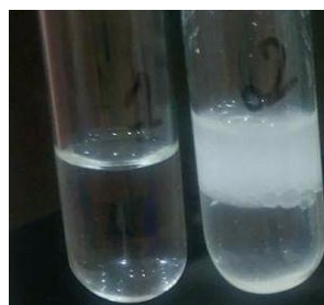
c. Phát hiện lipid trong dầu dừa