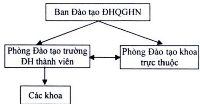
Sơ đồ 1. Mô hình quản lý và tổ chức KTĐG ở ĐHQGHN (giai đoạn 1).

Để triển khai quy định này có hiệu quả, công tác KTĐG trong ĐHQGHN cần có sự phối hợp thực hiện giữa các đơn vị sao cho vừa đảm bảo được chất lượng vừa đáp ứng được tính liên thông và sự linh hoạt của phương thức đào tạo theo tín chỉ. Phương thức tổ chức KTĐG thống nhất có sự phối hợp, liên thông trong ĐHQGHN được minh họa ở sơ đồ 1.