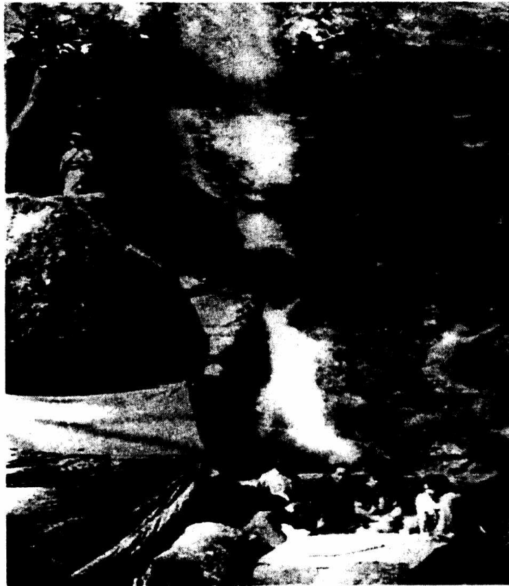
Tại sở chỉ huy chiến dịch tại hang Thẩm Púa - Tuần Giáo - Điện Biên Phủ, Đại tướng Võ Nguyên Giáp quyết định kế hoạch tấn công Điện Biên Phủ. (BTQB 1109)

Giao thông vận tải là một mặt trận cực kỳ quan trọng để đảm bảo cho chiến dịch thắng lợi. Đây là một trận địa không thể thiếu được của chiến dịch và cũng gay go, ác liệt không kém gì chiến đấu. Hình ảnh về những đơn vị làm đường đã được thể hiện trên nhiều tấm ảnh, như tấm ảnh chụp một đơn vị bộ đội cùng với dân công và thanh niên xung phong đang đào một đoạn đường giữa rừng cây (7) . Trên ảnh, một tốp bộ đội với chiếc mũ nan bọc vải, cùng với những cô thanh niên xung phong, dân công người Thái, đang khiêng đất, đá. Tấm ảnh cho chúng ta thấy công việc lao động thật vất vả, nhưng không khí làm việc lại rất vui vẻ tự nguyện. Có những đoạn đường phải qua núi đá cao, bộ đội đã phải dùng mìn để phá đá (8) , những nơi gần địch chỉ được dùng xà beng, cuốc xẻng đào đất đá để bảo vệ bí mật cho con đường.